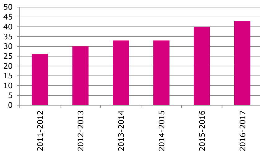
Figuur 2: Aantal Bètapartnerscholen per schooljaar

Een ander belangrijk effect van onze aanpak is dat we de verbinding tussen VO en HO docenten tot stand brengen. Deelname aan onze activiteiten zorgt voor meer begrip en waardering voor elkaars werk.